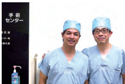
▲平中副院長（整形外科主任部長）と一緒に

しかし、人工膝単顆置換術(UKA)と人工膝関節全置換術(TKA)、いずれもフォローしていくことが非常に重要です。近い将来、自国の関節形成術のグループに参加したいと思っています。