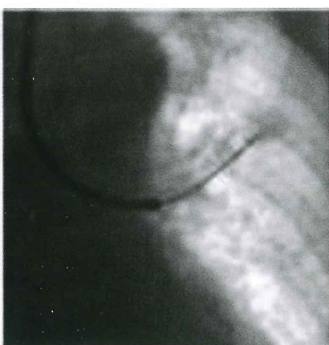
気管支腔内超音波断層法(EBUS)

気管支炎でも見られる一般的な症状が多く、また無症状で進行することもあり、早期発見がなかなか難しい病気です。よって、レントゲンやCTによる定期検診や、1ヶ月以上続く咳、痰や血痰を認めたら早めに医療機関を受診するなどの心がけが大切です。もし肺がんが疑われたら、呼吸器内科専門医を受診し、気管支鏡などの精密検査を受けて頂きます。肺は気管支が複雑に枝分かれして、迷路のような構造になっているため、病変の部位によっては気管支鏡で組織を採取することが難しいことがあります。当院ではCT画像から病変への気管支の経路を計算して誘導するヴァーチャル気管支鏡や、細い超音波装置を使って病変に到達しているかを確認できる気管支腔内超音波断層法(EBUS)を駆使して、よ