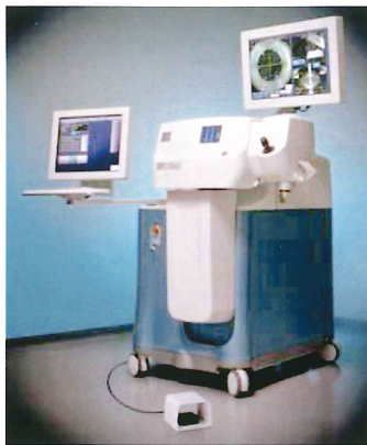
フェムトセカンドレーザーの機器

さらに今後はフェムトセカンドレーザー白内障手術システムの導入を予定しております。これは白内障手術の大事なポイントとなるパーツを、事前に正確に計測されたデータをもとに手術予定部位をレーザーが人の手に代わり行うもので、術者の経験や技量に頼らない次世代の白内障手術システムとよばれています。フェムトセカンドレーザー導入は大阪府下で3施設目となりますが、手術用顕微鏡や周辺機器と連動したシステムとしては日本初導入となります。