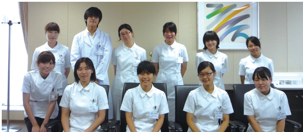
大阪府主催『一日看護師体験』 私立関西大倉高等学校のみなさん

看護部では年に数回、看護師を目指す高校生や社会人を対象に、二日看護師体験の受入れを行っています。今年度は大阪府看護協会主催の『ふれあい看護体験』、大阪府主催の『一日看護師体験』に大阪府立大冠高等学校・私立関西大倉高等学校などから計20名の参加がありました。プログラムは、ユニフォームに着替えた後、病院の概要説明及び病院見学を行い、各病棟に分かれて看護師と行動を共にし、入浴介助や注射の準備の見学などを行っていただきました。最後に『まとめの会』で一日の感想を伺っています。 まとめの会では「大変そうだけれど看護師になりたいという気持ちが強くなった」といった感想を聞いたり、スタッフが一日看護師体験を受けた時の気持ちを思い出したりと、看護師が初心にかえる機会にもなっています。今後もこうした機会を通して看護への理解が深まることを願っています。